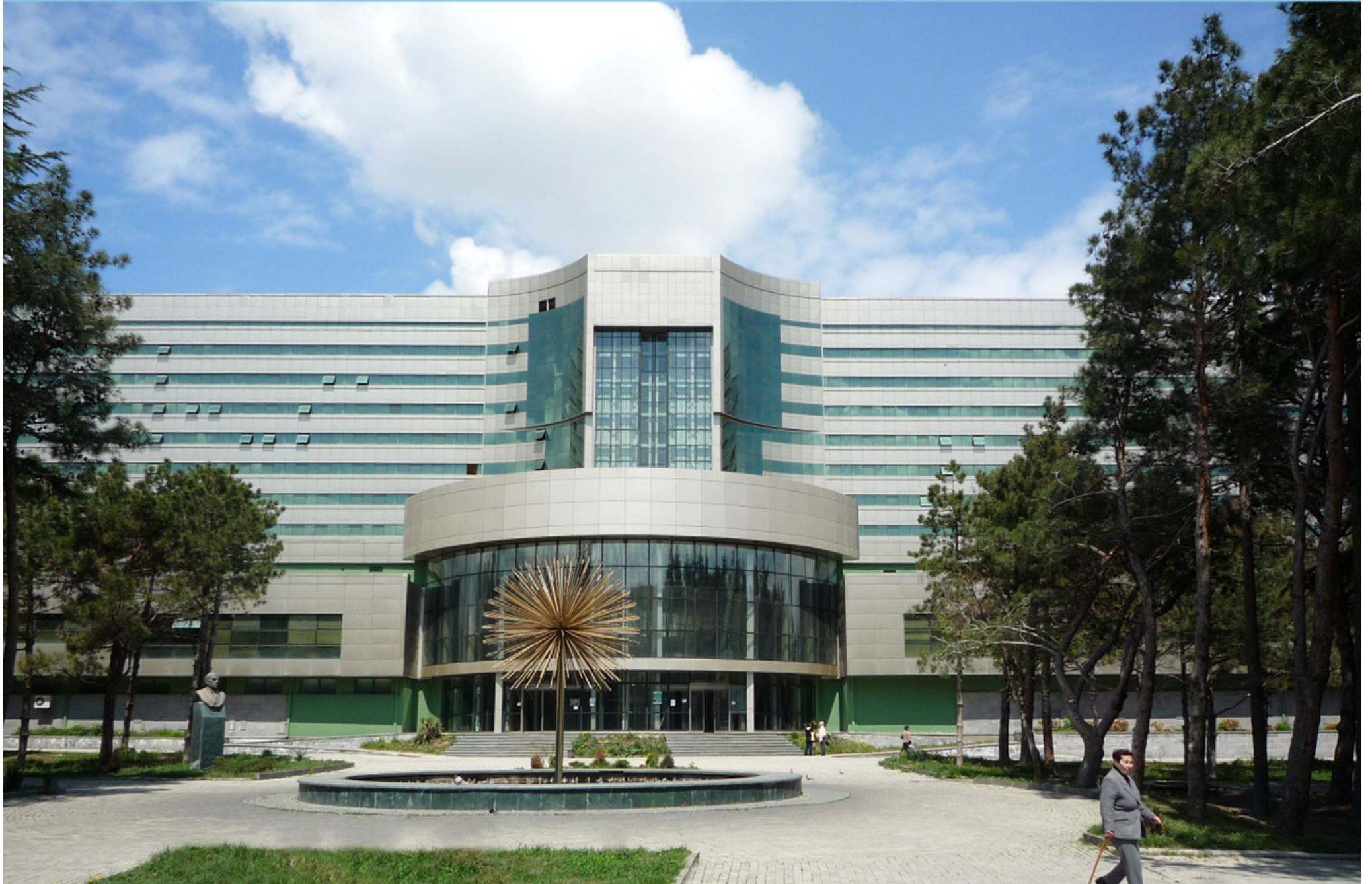
Pavilion expansion and reconstruction connected to hospital part with bed department | Hospital Tbilisi | Georgia | 2007