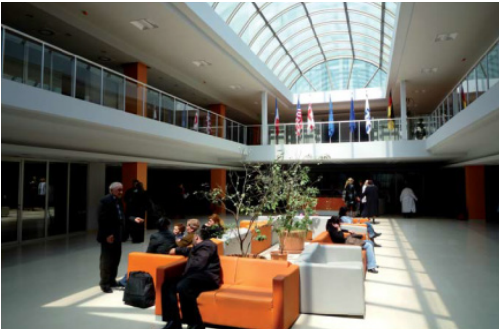
Pavilion expansion and reconstruction connected to hospital part with bed department | Hospital Tbilisi | Georgia | 2007